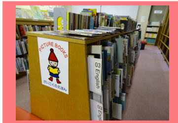
がいこくこえほん 〈外国語の絵本コーナー〉

こども図書館では、様々な国の言葉や遊び・文化にふれるおはなし会を、年に5回程度実施しています。各国の絵本の読み聞かせや、あいさつ・遊びを通して、国際理解を深めることができると、毎回多くの方に参加していただいています。