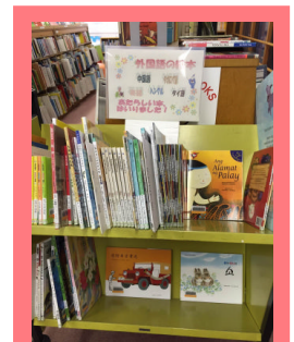
へいせい ねんどこうにゅうとしよ 〈平成26年度購入図書〉