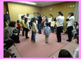
こ 〈フランス語でフルーツバスケット!〉

また、外国語の絵本を毎年購入しています。現在およそ28言語・6,000冊を所蔵し、言語ごとに絵本コーナーに並べています。日本とは違う生活習慣や文化が描かれたもの、『はらぺこあおむし』など人気絵本の原書、『ぐりとぐら』のようなおなじみの絵本が外国の言葉に翻訳されているものなど、楽しい絵本がたくさんあります。どうぞ手にとってごらんください。