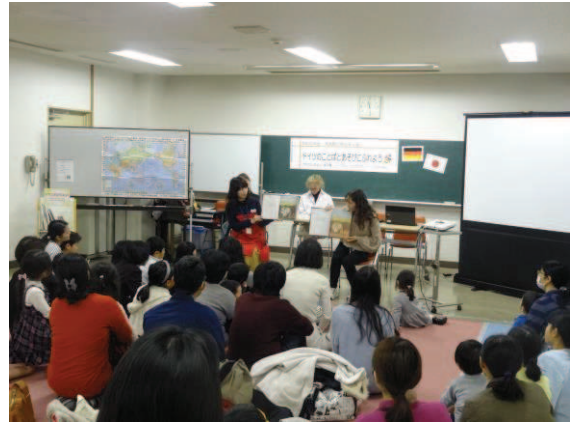
「ドイツのことばとあそびにふれよう」