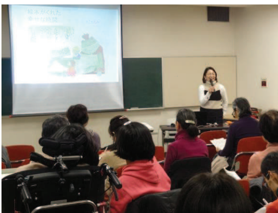
「絵本がくれた幸せな時間」