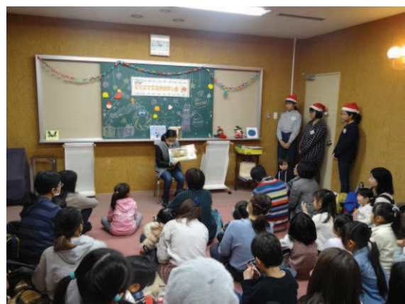
「クリスマスのおはなし会」