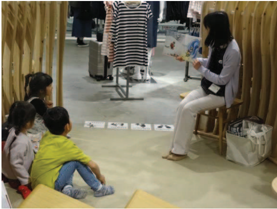
無印良品広島パルコでのおはなし会