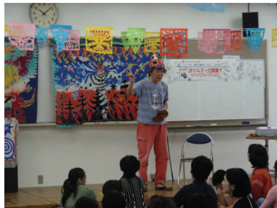
「カンムリ+万国旗？ つくってパレードしよう！」