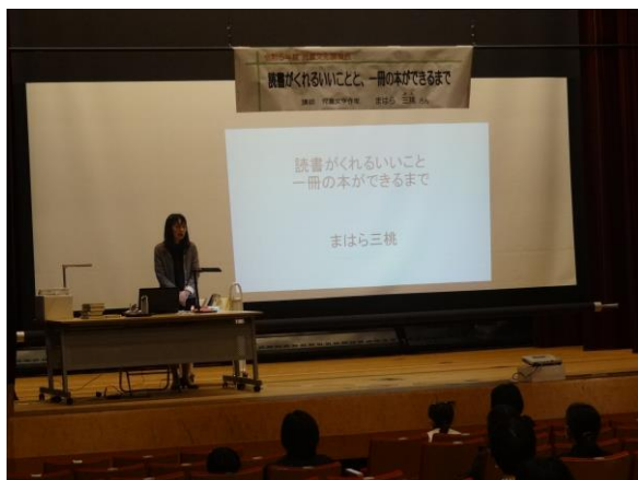
児童文化講演会 「読書がくれるいいことと、一冊の本ができるまで」