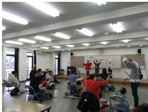
ライブラリー・サポーターズ 「クリスマスのおはなし会」