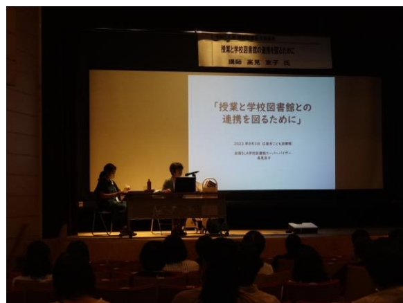
学校図書館支援講座 「授業と学校図書館との連携を図るために」