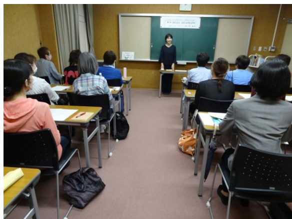
子どもと本を結ぶボランティア養成講座 初心者編