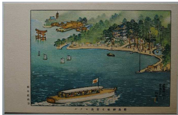
「厳島神社と宮島ホテル」