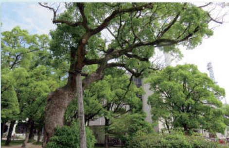
広島城お堀端、RCC北西のクスノキ(2017年5月)