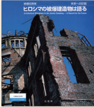
『ヒロシマの被爆建造物は語る』 被爆建造物調査研究会／編 広島平和記念資料館 1996年

被爆の惨禍に耐え、現存する被爆建造物は、被爆の惨状と、復興へと立ち上がる広島市民の暮らしや町の様子を見届けてきました。今年度の企画展では、被爆建造物のなかでも被爆橋梁と被爆樹木に焦点をあて、写真集や記録などの資料を展示します。