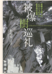
『被爆樹巡礼』 杉原梨江子／著 実業之日本社 2015年