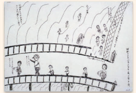
『市民が描いた原爆の絵』(比治山橋) 落合フミコ／画 広島平和記念資料館／提供