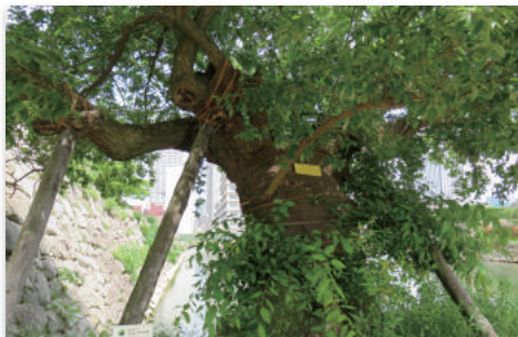
広島城二の丸のマルバヤナギ(2017年5月)