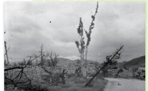
広島城二の丸のユーカリとマルバヤナギ(1945年10月)