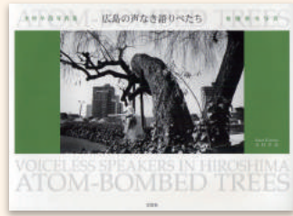
『広島の声なき語りべたち』 木村早苗／著 文芸社 2008年