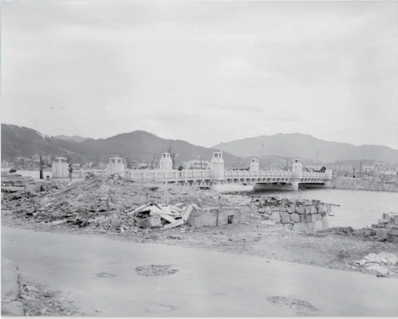
京橋(1945年11月頃)