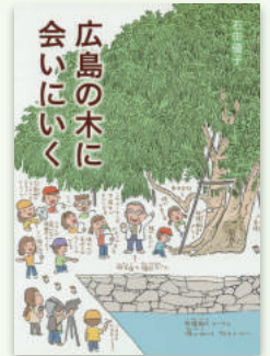
『広島の木に会いに行く』 石田優子／著 偕成社 2015年