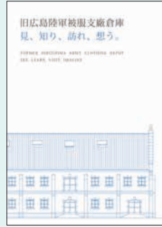
『旧広島陸軍被服支廠倉庫 見、知り、訪れ、想う。』 アーキワーク広島／製作 アーキワーク広島 2017年