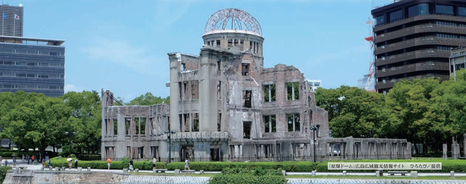
「原爆ドーム」広島広域観光情報サイト ひろたび/提供