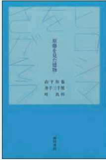
『ヒロシマをさがそう 原爆を見た建物』 山下和也／著 井手三三男／著 叶真幹／著 西田書店 2006年

被爆者の高齢化が進み、次世代への被爆体験の継承が課題となっています。物言わぬ被爆建物もまた、被爆体験を次世代に伝える重要な役割を担っています。今年度は被爆建物に焦点を当て、活用や保存などについて、所蔵資料や写真パネルで紹介しします。また、企画展会場内にて被爆建物に関する映像のリポート再生を行います。