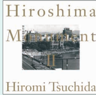
『ヒロシマ・モニュメントII』 土田 ヒロミ／著 冬青社 1995年