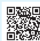
広島市立図書館 二次元コード