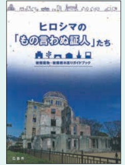
『ヒロシマの「もの言わぬ証人」たち 被爆建物・被爆樹木巡りガイドブック』 広島市市民局 2018年