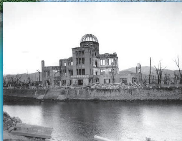
「広島県産業奨励館(原爆ドーム)」(1945年10~11月撮影)