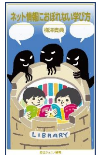
『ネット情報におぼれない学び方』 梅澤 貴典 著 岩波書店