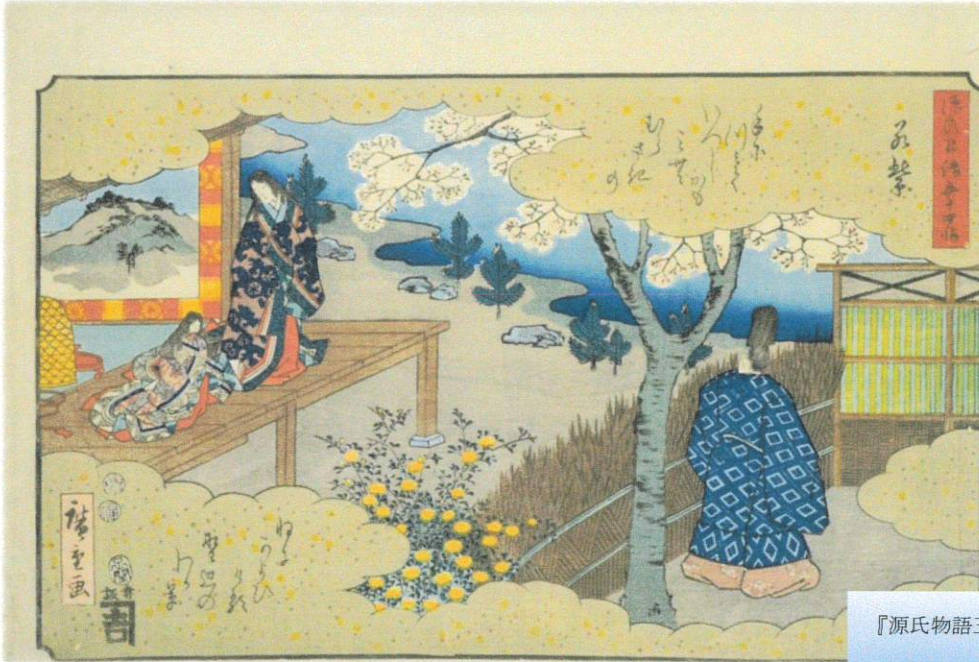
『源氏物語五十四帖 若紫 (源氏物語五十四帖)』