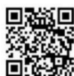
広島市立図書館 ホームページ