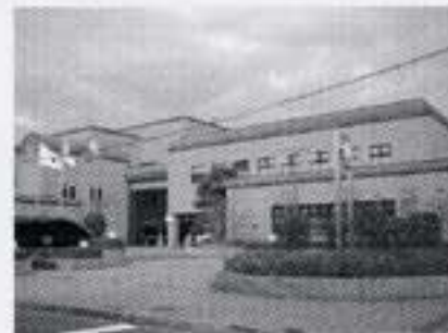
佐伯区図書館 (佐伯区民文化センターと併設)