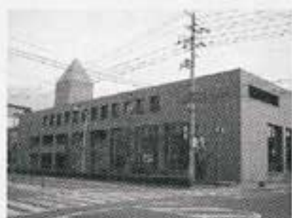
東区図書館 (東区民文化センターと併設)