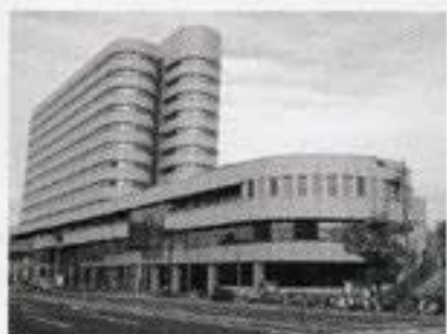
南区図書館 (南区民文化センターと併設)