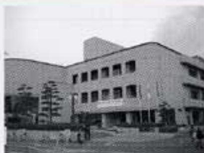
安佐南区図書館 (安佐南区民文化センターと併設)