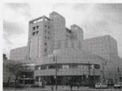
中区図書館 (アステールプラザ内)

中区基町3番1号 TEL.222-5542 ※本の照会・相談は TEL.222-6440