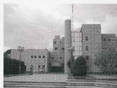
こども図書館 (こども文化科学館と併設)