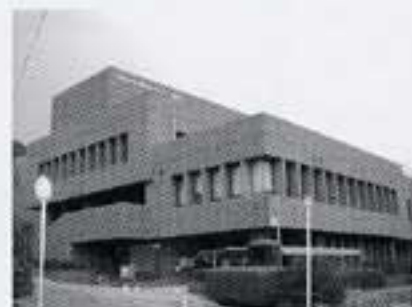
安佐北区図書館 (安佐北区民文化センターと併設)