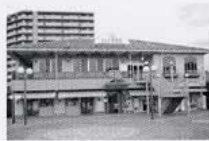
まんが図書館あさ閲覧室 (上安バスターミナルベルテガーデン内)