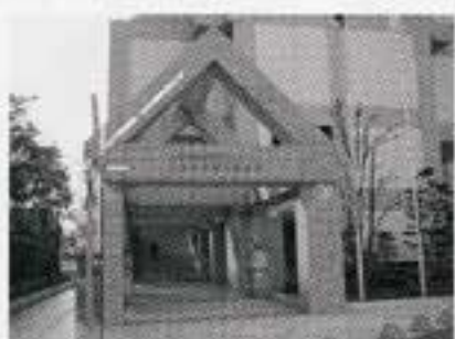
西区図書館 (西区民文化センターと併設)