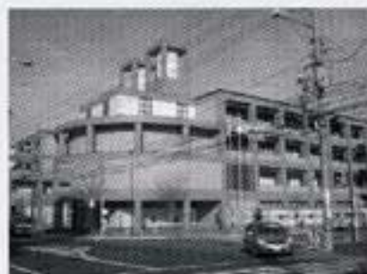
安芸区図書館 (安芸区民文化センターと併設)