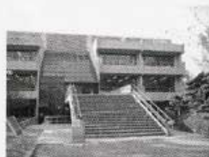
中央図書館 (映像文化ライブラリーと併設)

中区基町3番1号 TEL.222-5542 ※本の照会・相談は TEL.222-6440