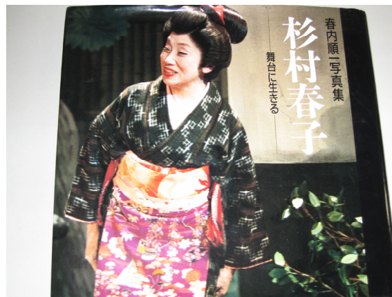
『春内順一写真集 杉村春子 -舞台に生きる-』春内順一著（集英社1991年）