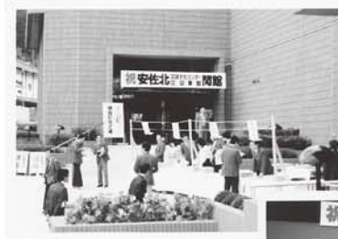
開館記念事業の様子

一般図書や児童図書とともに区内の郷土・行政資料も収集し、地域の身近な図書館として、貸出・返却やおはなし会などの事業を行っています。また、広範囲のサービス対象地域をカバーするため、区内の公民館、集会所等への配本も行っています。