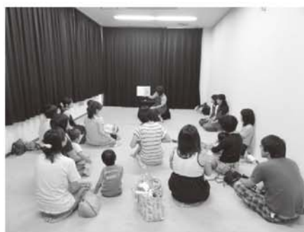
「おはなし会」の様子

本の貸出 ・・・現在、約7万冊の本を所蔵しています。文学、家庭、社会科学、歴史分野などの本に人気があります。当館では安佐北区の地域性から「農業・園芸」分野を積極的に収集しています。また、毎回テーマに沿った本を集めて行う月別展示、2週間ごとのミニ展示を通じて、これまであまり知られていなかった本を利用者の方々に紹介しています。