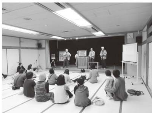
「おはなし会と紙芝居の集い」の様子

今年の5月には、開館30周年記念事業として「おはなし会と紙芝居の集い」を開催しました。ボランティアの皆さんによる絵本の読みきかせと、区内を中心に活動する皆さんによる紙芝居を上演し、多くの方々に楽しんでいただきました。