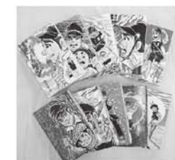
『はだしのゲン』(汐文社)

また、広島市立広島商業高等学校との連携企画として、同校が平和への貢献と学習成果の発表を目的とし、平成19年度（2007年度）から開催している「広島市商ピースデパート」で制作したモニュメントや、同校の平和への願いを込めた活動を紹介합니다。