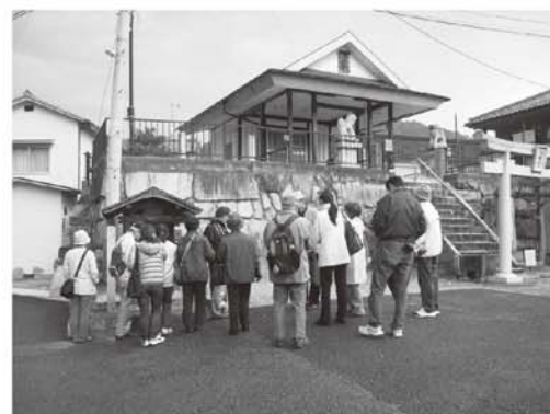
「可部町歩き」の様子

もよおしもの ・・・「可部町歩き」では、名所・旧跡を歩いてめぐりながら講師の解説を聞き、町の新しい魅力