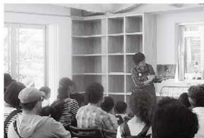
昨年度のこんちゅう館での出前おはなし会の様子