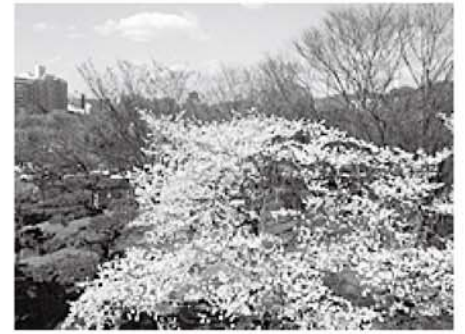
広島資料室から見える桜

これを機に、本展では、広島市が行う花と緑の広島づくりの推進についての各種事業の紹介や、平和記念公園や中央公園、植物公園など広島市の特色ある公園の紹介、関係する図書・パネル写真の展示などを行います。このほか、関連行事として市政出前講座を開催します。