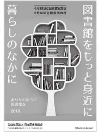
図書館記念日・図書館振興の月 ポスター 2018年

法律の公布から70年近くが経ちますが、図書館は今も変わらず、無料で様々な分野の情報や知識を得ることができる場所です。そして、広島市立図書館も、本が借りられるだけでなく、皆さんの課題解決のための場所として活用いただけるよう、ビジネスシーンで使える情報の提供や、暮らし、環境、健康をはじめとした生活に密着した情報の発信などを行っています。さらに、デジタル情報やICTの活用を図るなど時代の要請に応じたサービスを展開し、地域の知の拠点として、引き続き図書館の持つ機能を発揮し続けます。