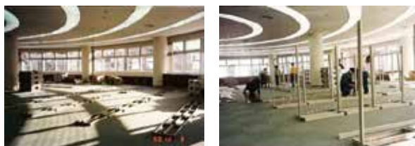
開館準備中の様子。現在と見比べてみてください。

中区図書館はこれからも、様々な情報発信や、皆様にお楽しみいただける行事の開催等に取り組んでいきます。皆様の笑顔が輝く場所となるよう努めてまいりますので、ぜひご来館ください。