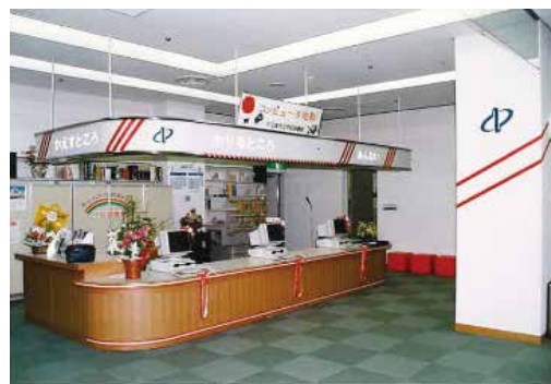
オープン前日のカウンターの様子

その中で、中区図書館は、芸術関連と国際理解に関する情報発信を特色としており、資料収集や行事の開催などにより、美術、芸能や国際交流等に親しめる機会を多数提供しています。