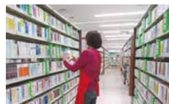
中央図書館での活動の様子

これらの活動にご興味のある方は、各図書館へお問い合わせください。 （「ボランティア養成講座」の受講が必要な活動もあります。）